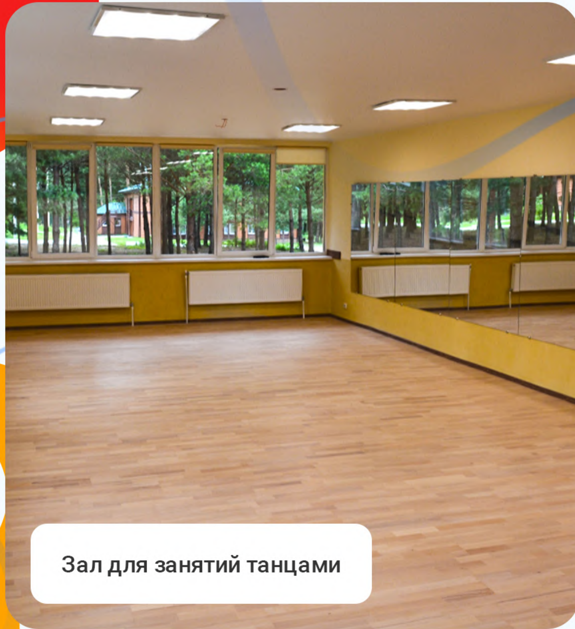
Зал для занятий танцами